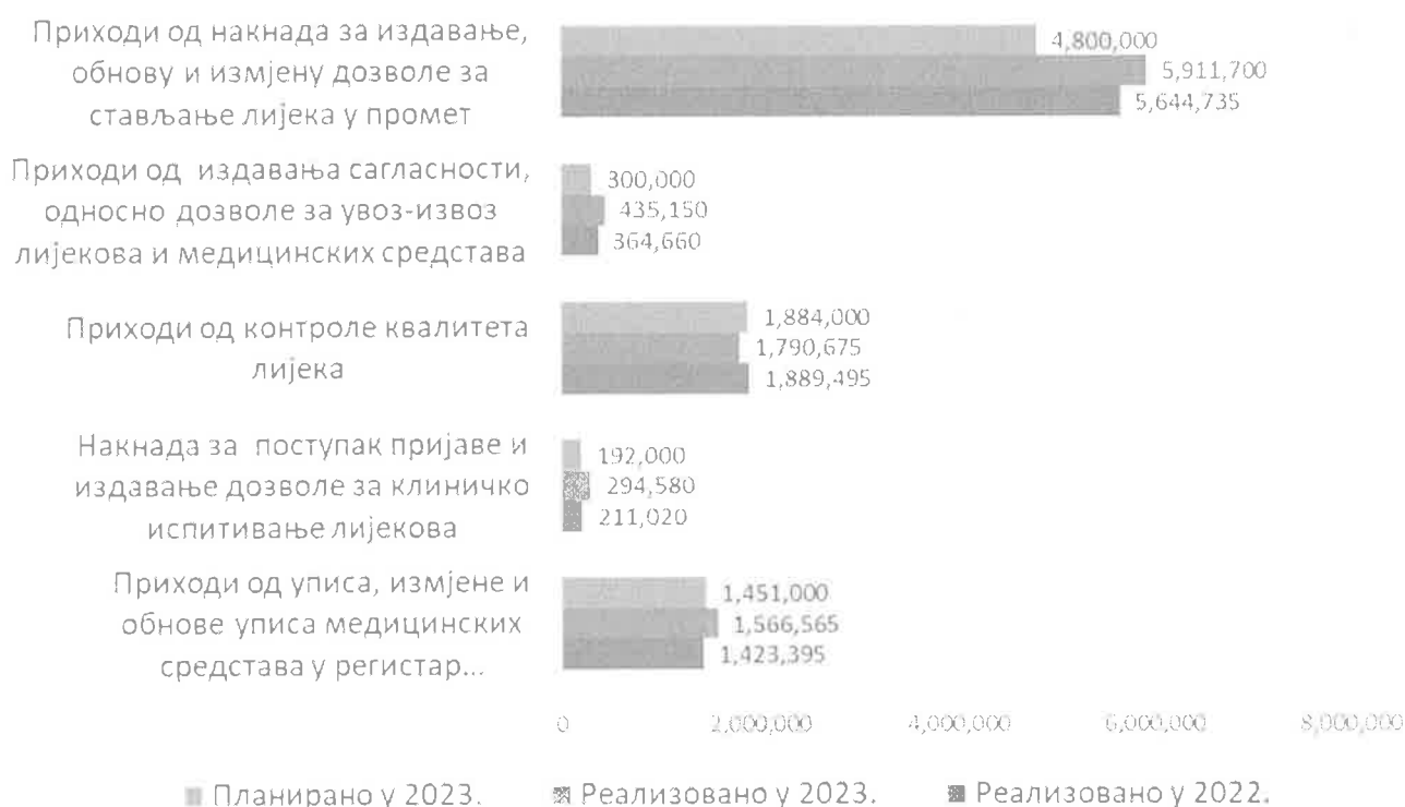
Слика 2. Упоредни преглед реализације „носећих“ врста прихода за 2023. годину

У наставку је приказан упоредни преглед реализације пет „носећих“ врста прихода које учествују са око 97,45 % у укупно оствареним приходима од накнада из дјелатности Агенције: