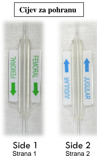
Slika 2- Ispravan otisak na cijevi za pohranu